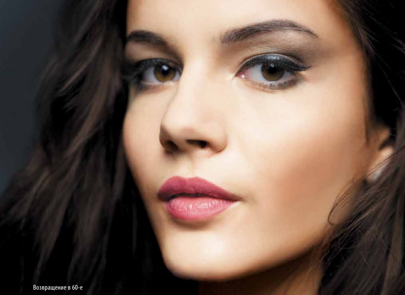
Возвращение в 60-е

и на протяжении всего года мой график плотно расписан. Поэтому мы спланировали наши курсы с учетом графика моей работы. Более того, в мою группу для проведения мастер-классов я выбираю топ-визажистов: профессионалов с большим опытом работы и желанием бесконечно совершенствоваться в данной профессии.